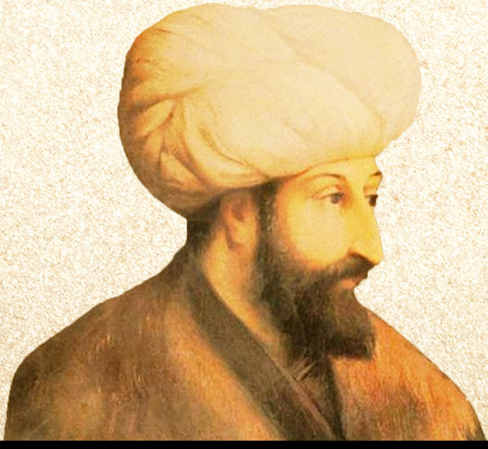
Fatih Sultan Mehmet