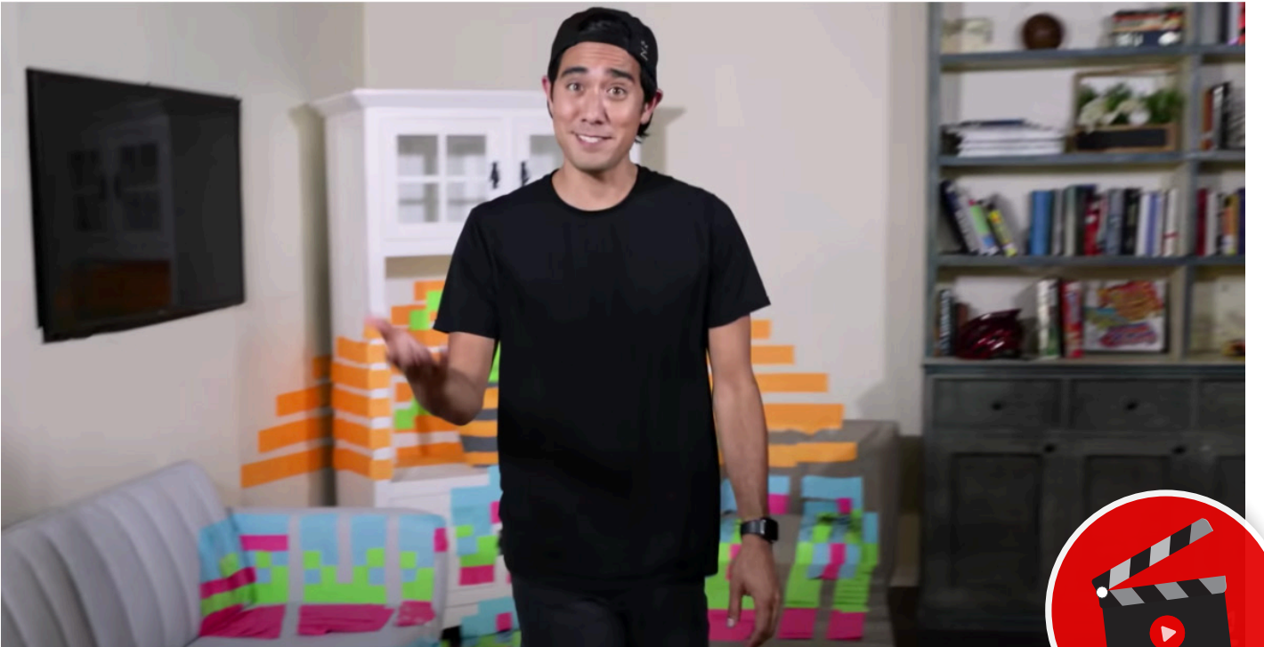
Zach King – Yeni nesil dijital illüzyonist

biri Zach King adlı arkadaşımız. Kullandığı efektleri canlı bir performansta gerçekleştirmek ya mümkün değil, ya da pratik olarak hayata geçirmesi oldukça güç. Teknolojinin bu kadar geliştiğinin farkında olmayan bir kitle; yıllardır çalışmış emektar bir illüzyonistin sunduğu gösteri ile dijital dünyanın imkanlarını kullanarak 'inanılmaz' efektler ortaya koyan kişiyi kıyasladığında, emektar kardeşimizi haksız bir rekabete sokuyor.